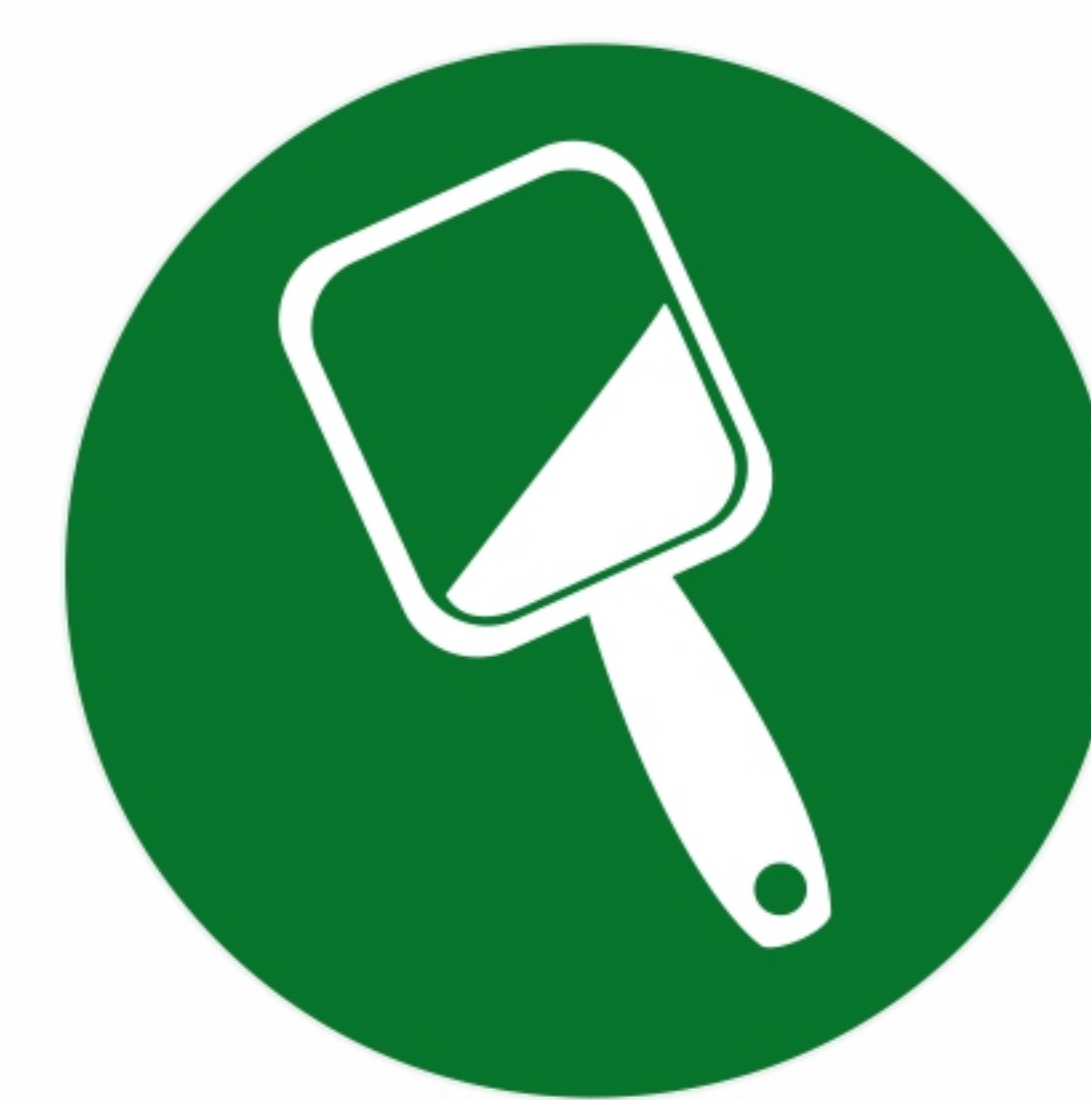
предметы домашнего обихода

Крупногабаритные отходы вывозятся без взимания с населения дополнительной платы.