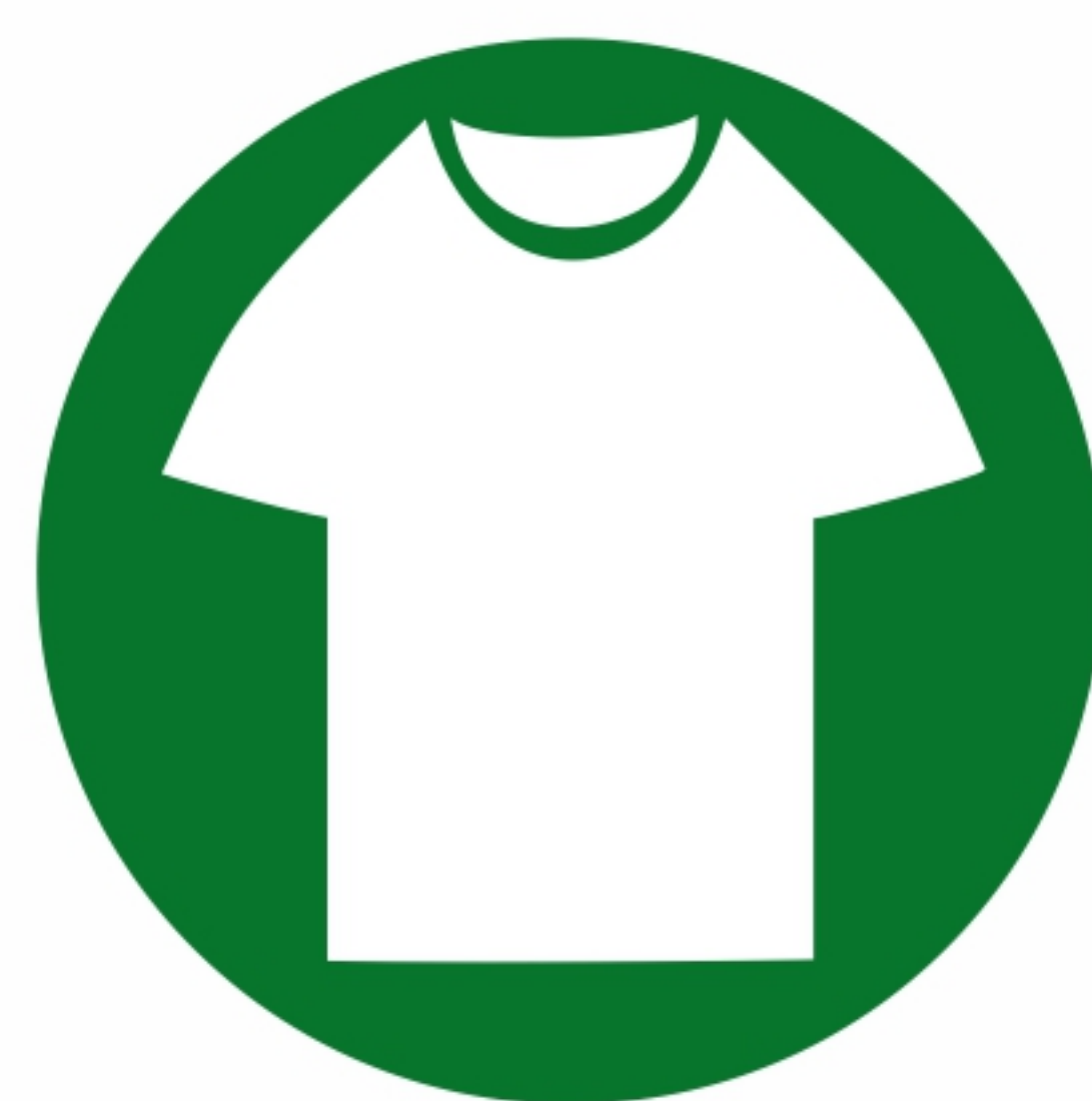
товары народного потребления