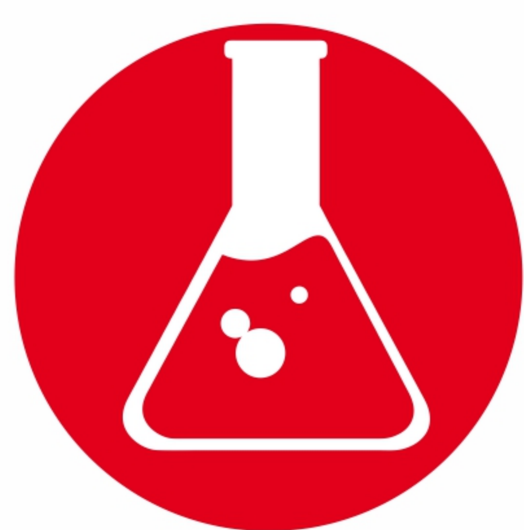
медицинские и жидкие бытовые отходы